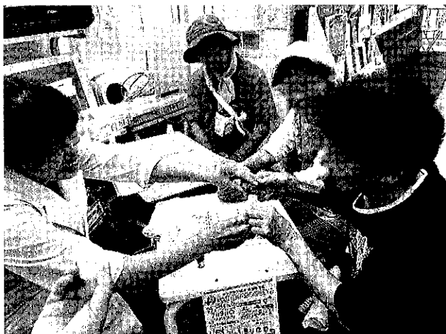
アロマスプレーづくり

健康教室の告知は局内外へのポスター掲示と、来局者へのチラシの配布で行っています。どれくらいの方が来てくださるのか不安と期待で迎えた1回目。参加者は2名と少しがっかりした結果となりましたが、ある時、薬局の外に向けて掲示しているポスターが、たまたま通りかかった地域介